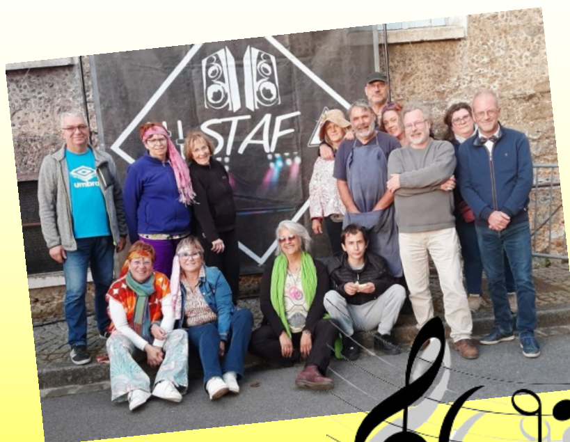
LA FÊTE DE LA MUSIQUE ET TOUTE SON EQUIPE DE STAF