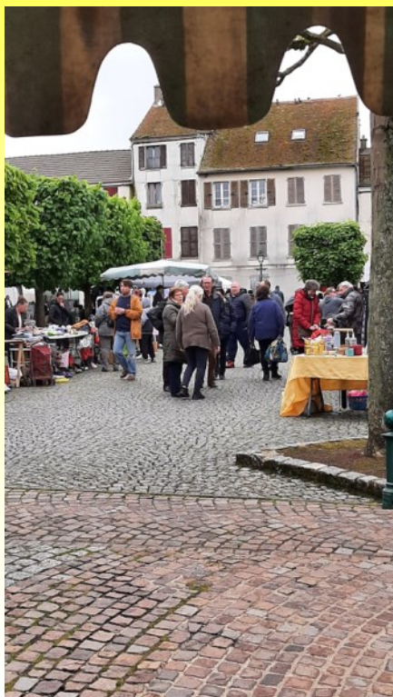
UNE DES BROCANTES